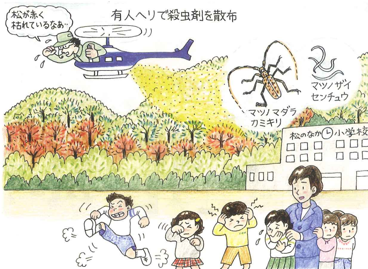
イラスト：安富佐織

松枯れの原因とされるマツノザイセンチュウを媒介するマツノマダラカミキリを殺すという名目で、30年以上にもわたって松林に農薬空中散布が続けられています。しかし松枯れは止まらず、農薬の効果は不明瞭のままです。一方で、松枯れの原因は松枯れ病だけでなく、森林の自然の変遷によるものという指摘もあります。